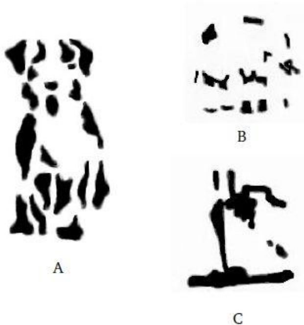
Figura 5.1. figuras incompletas.

También es más fácil percibir lo familiar que percibir lo que no lo es. Estudie la figura 5.1 hasta que haya identificado los tres elementos.