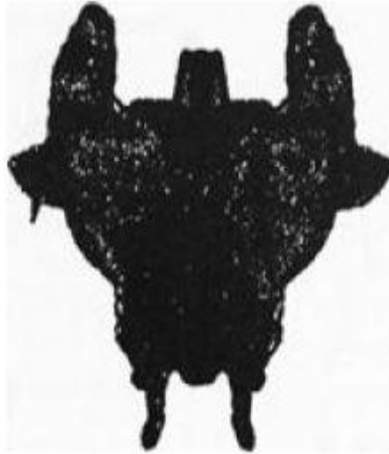
Figura 5.2. ¿Una mancha de tinta o...?

clásico estudio de imaginación, Bartlett notó que a los sujetos a los que se les pedía interpretar las manchas de tinta, frecuentemente revelaban mucha información sobre sus intereses personales y ocupaciones. Por ejemplo, la misma mancha de tinta le recordaba a una mujer “un gorro con plumas”, a un pastor protestante “el fiero horno de Nabucodonosor” y a un fisiólogo “una representación de la región basal lumbar del sistema digestivo”. 2 Vea la figura 5.2: ¿que le recuerda a usted la mancha de tinta?